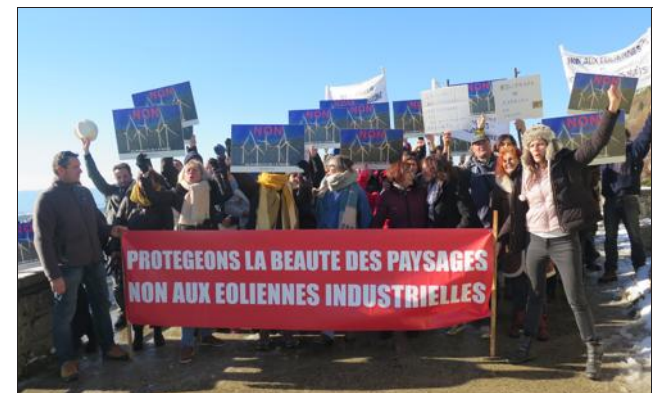
Une première manifestation s'est déroulée au col de Meyrand pour dire "Non aux éoliennes", "Oui aux paysages" le 18 novembre dernier.

Une pétition est en ligne sur https://www.eole07.fr