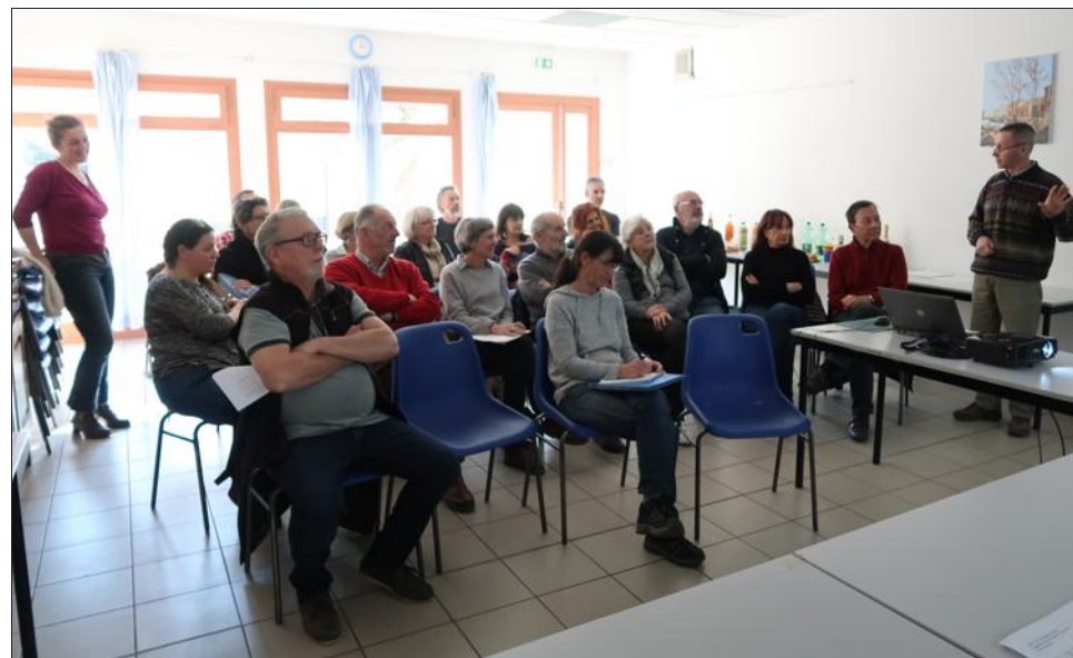
L'assemblée générale d'Avis de tempête cévenole s'est déroulée samedi à Prades.